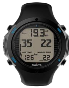
D6i NOVO BLACK 30,000円買取!!