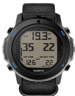
D6i NOVO BLACK ZULU 40,000円買取!!