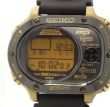
スキューバマスター-M726