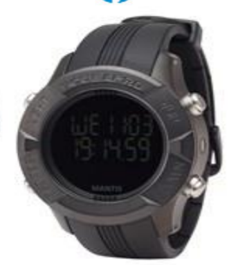
M1 BLACK 20,000円買取!!