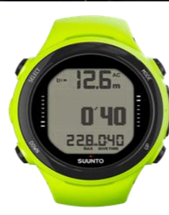
D4i NOVO 25,000円買取!!