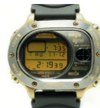
スキューバマスター-M725