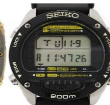
スキューバマスター-M705