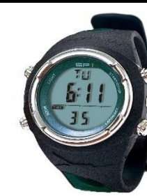
SP-1 フリーダイビング専用