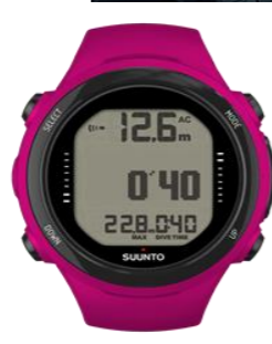
D6i NOVOその他カラー 27,000円買取!!