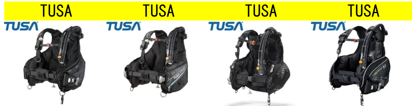
TUSA TUSA TUSA TUSA BCJ-4000 SOVERIN 40,000円買取!! BCJ-0102 SOVERIN α 30,000円買取!! BCJ-1800 Voyager 20,000円買取!! BCJ-0101 10,000円買取!!