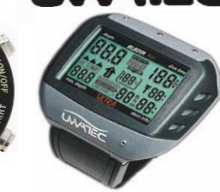
中古であっても、ベルト切れ、画面傷なく、動作良好なら