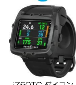
i750TC DAIKON 45,000円買取!!