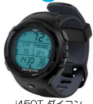
i450T DAIKON 35,000円買取!!