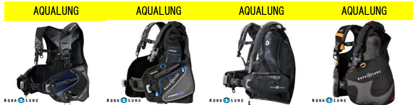
AQUALUNG AQUALUNG AQUALUNG AQUALUNG AXIOM i3 40,000円買取!! PRO HD 25,000円買取!! ZUMA 15,000円買取!! WAVE BC 10,000円買取!!