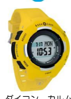
DAIKON CALM 20,000円買取!!

このページに記載されている買取価格は箱・説明書付き、サビ・塩害なし、傷なし、汚れなしの美品状態での最高買取価格となります。