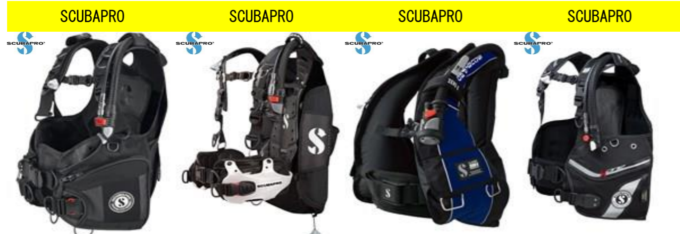
SCUBAPRO SCUBAPRO SCUBAPRO SCUBAPRO X-BLACK 40,000円買取!! HYDROS PRO 25,000円買取!! CLASSIC ZERO G 20,000円買取!! X-ONE 15,000円買取!!